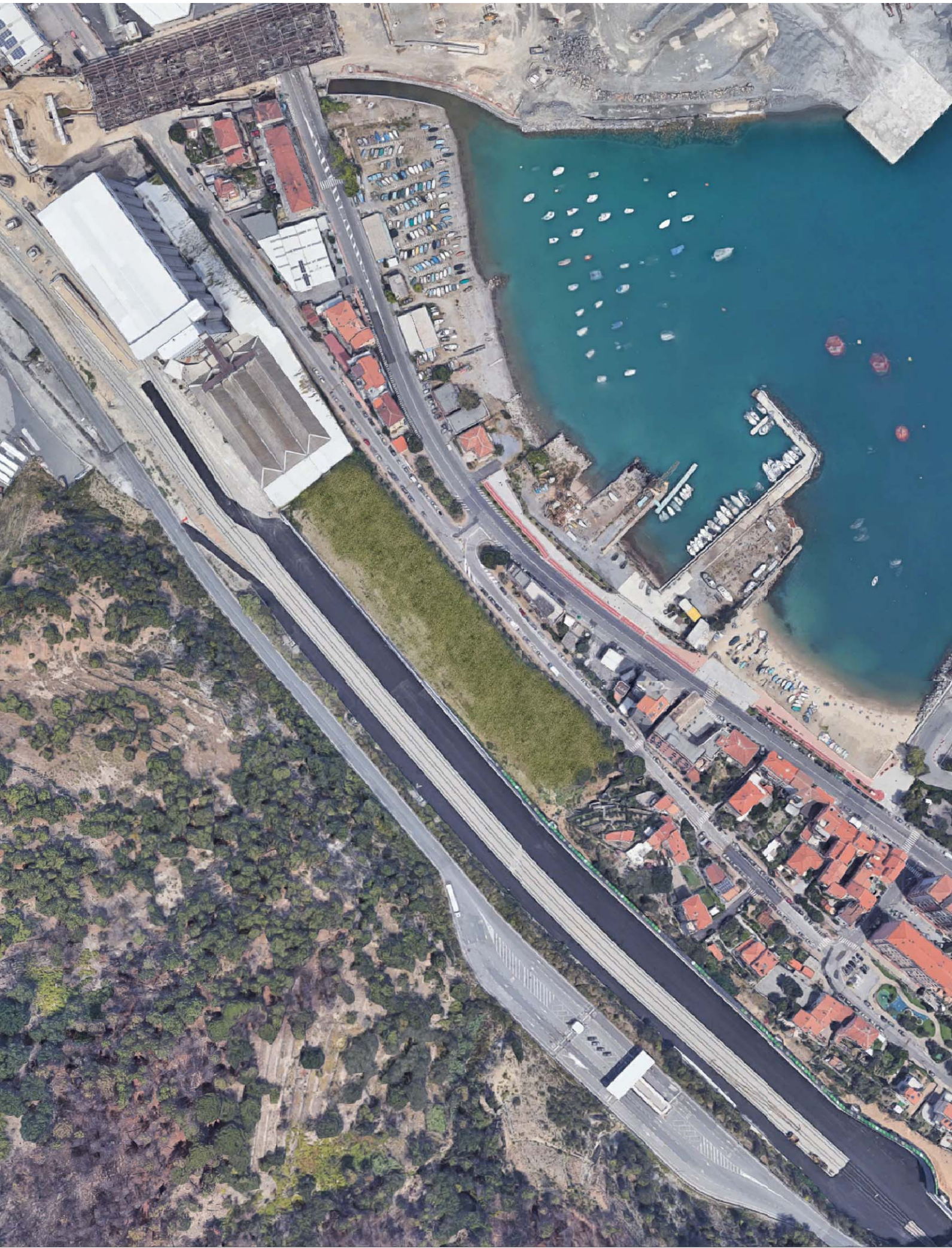
Ortofoto - stato di fatto