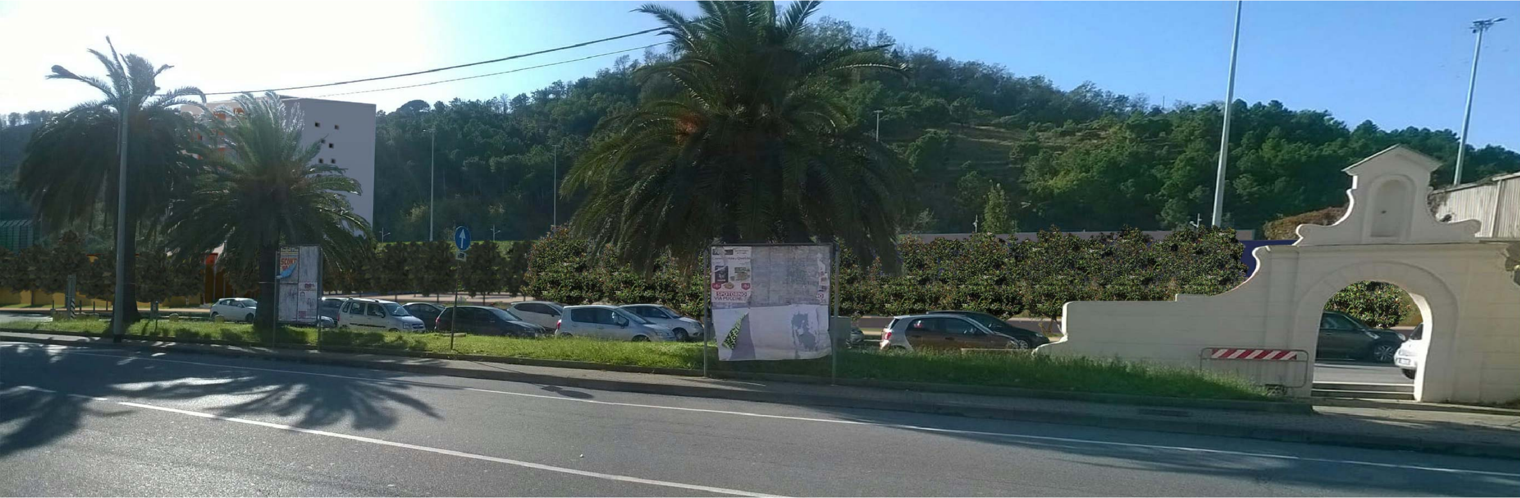
Vista da Via Aurella - fotoinserimento