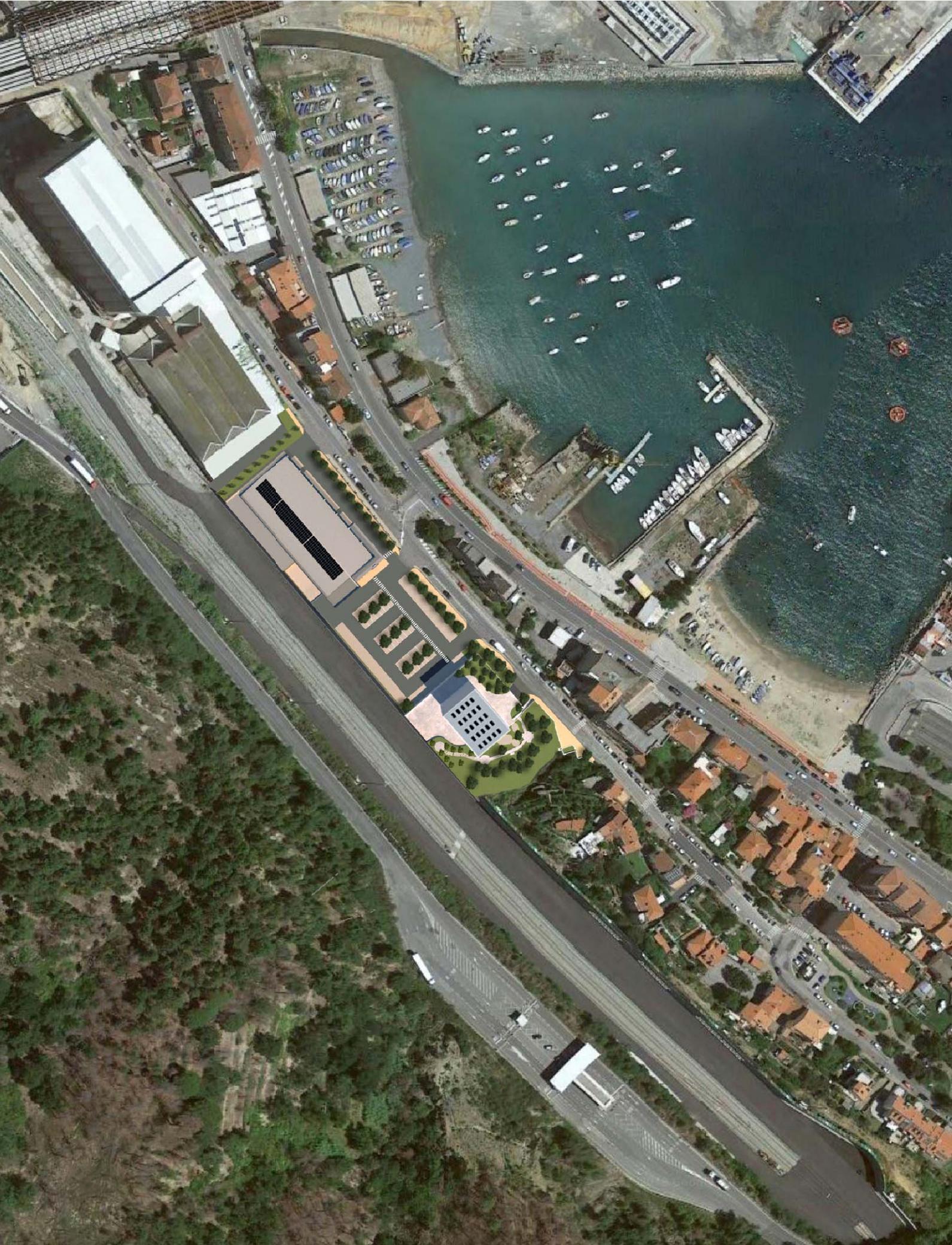
Ortofoto - progetto