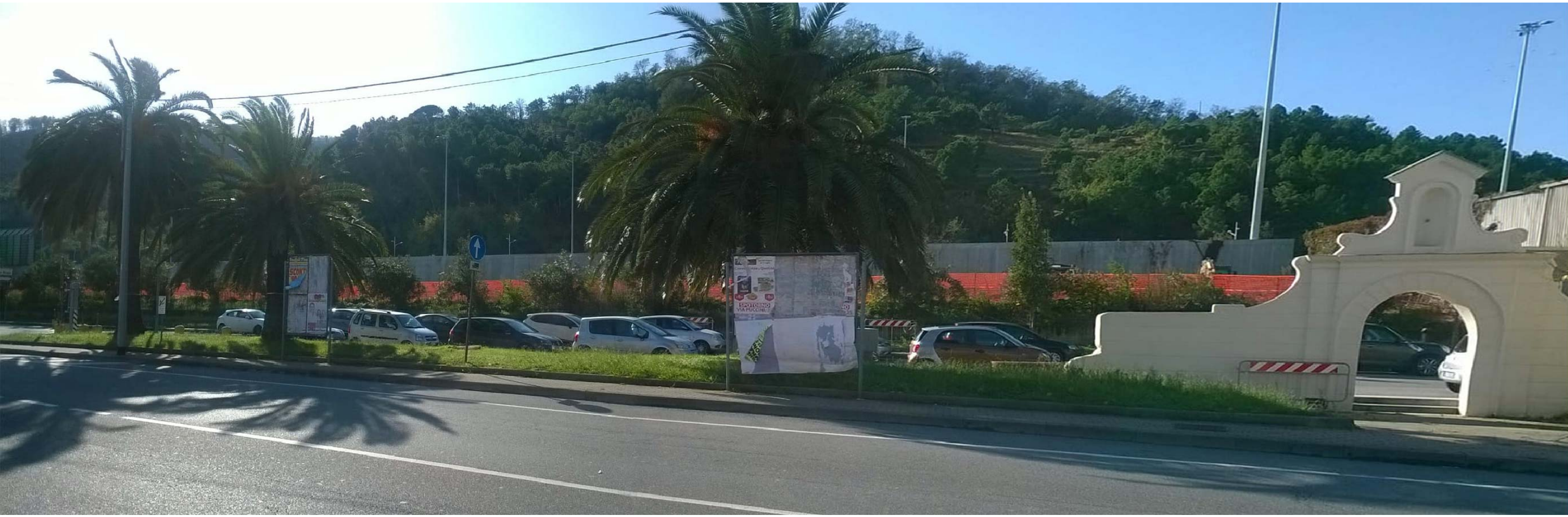
Vista da Via Aurella - stato di fatto