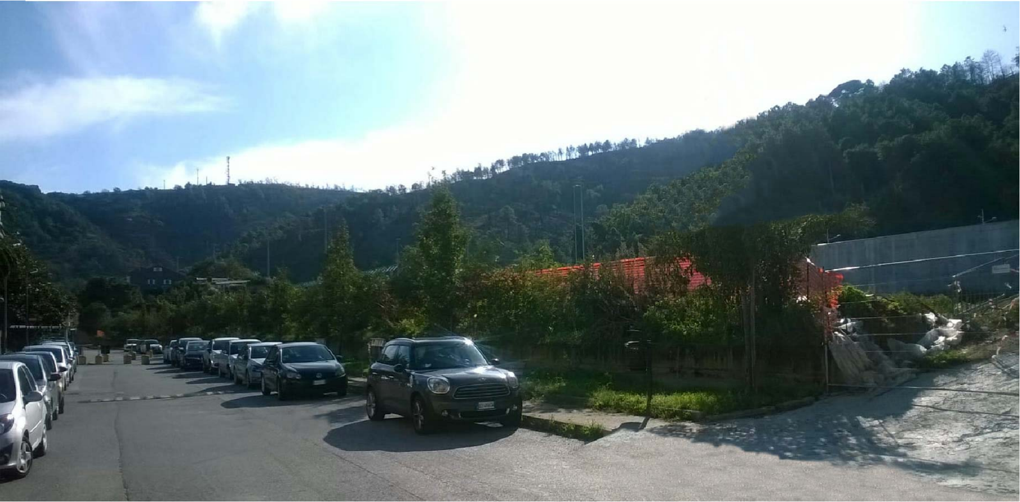
Vista da Via Braja - stato di fatto