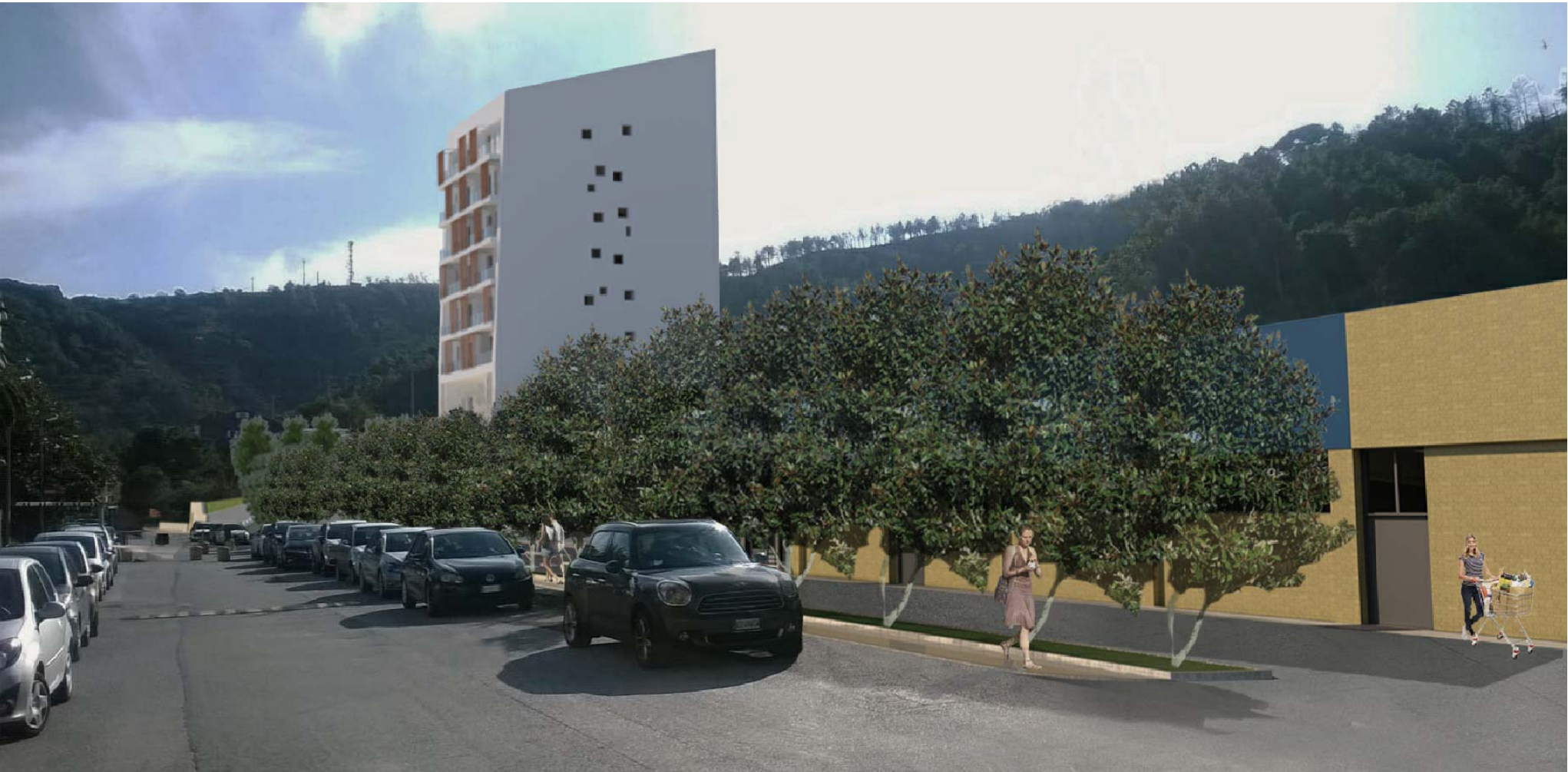
Vista da Via Braja - fotoinserimento